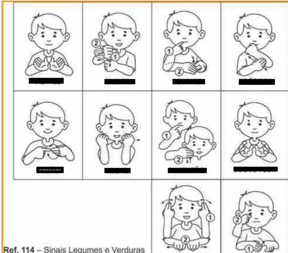
Ref. 114 – Sinais Legumes e Verduras

2) Vamos encontrar os números que correspondem aos sinais? Registrando o número nas figuras: